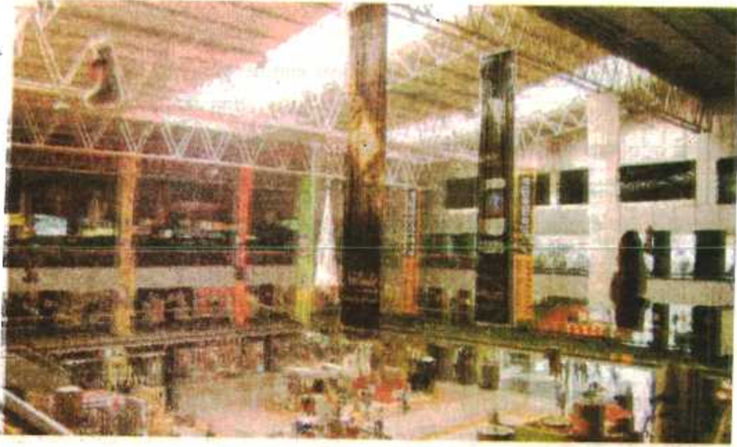
चित्र : 6.2 मॉल