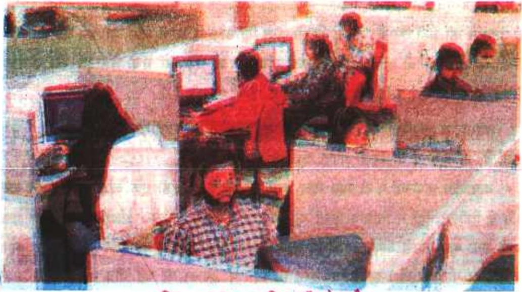
चित्र : 6.3 यह पटना स्थित कॉल सेन्टर है

निवेश (Investment) - परिसंपत्तियों जैसे- भूमि, भवन, मशीन एवं अन्य उपकरणों की खरीद में व्यय की गई मुद्रा को निवेश कहते हैं।