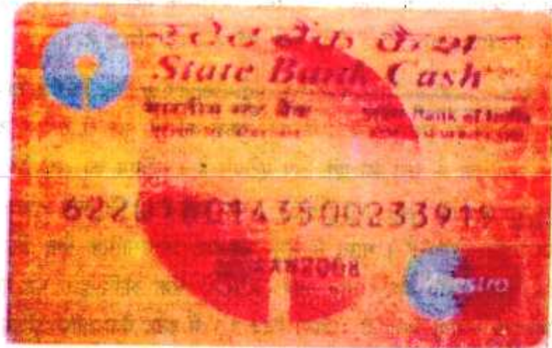
चित्र 3.4 : एटीएम कार्ड

उपरोक्त चित्र 3.4 में ATM कार्ड को देखा। एटीएम कार्ड मिलने के बाद एक गुप्त पिन नं० होता है जिसकी सहायता से ATM कार्ड को एटीएम मशीन में डालने के बाद रुपया निकाला जा सकता है। एटीएम मशीन से रुपया कैसे निकाला जाता है? इसे निम्न चित्र 3.5 में दिखाया गया है-