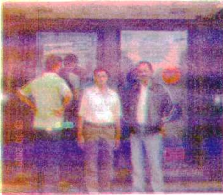
चित्र 3.3 : एटीएम केन्द्र

(1) एटीएम सह-डेबिट कार्ड (ATM-cum-Debit Card) - आर्थिक विकास के इस दौर में बैंकिंग संस्थाओं के द्वारा प्लास्टिक के एक टुकड़े को भी मुद्रा के रूप में उपयोग किया जाने लगा है । प्लास्टिक के मुद्रा का एक रूप एटीएम है । एटीएम का अर्थ है- स्वचालित टेलर मशीन (Automatic Teller Machine) । यह मशीन 24 घंटे रुपये निकालने तथा जमा करने की सेवा प्रदान कराता है । भारत में सभी बड़े-बड़े व्यावसायिक बैंक जैसे- स्टेट बैंक, इलाहाबाद बैंक, आई० सी० आई० सी० आई (ICICI) बैंक आदि द्वारा यह सुविधा अपने ग्राहकों को उपलब्ध करायी जाती है । निम्न चित्र 3.3 में स्टेट बैंक ऑफ इंडिया के एटीएम केन्द्र को दिखाया गया है ।