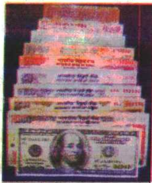
चित्र 3.2 : भारत में प्रचलित पत्र-मुद्रा

में विश्व के प्रायः सभी देशों में पत्र-मुद्रा का ही प्रचलन है। देश की सरकार तथा देश के केन्द्रीय बैंक के द्वारा जो कागज का नोट (Note) प्रचलित किया जाता है, उसे पत्र-मुद्रा कहते हैं। चूँकि यह कागज का बना होता है। इसलिए इसे कागजी मुद्रा भी कहा जाता है। भारत में एक रुपया के कागजी नोट अथवा सभी सिक्के केन्द्र सरकार के वित्त विभाग के द्वारा चलाया जाता है। दो रुपए या इससे अधिक के सभी कागजी नोट देश के केन्द्रीय बैंक-रिजर्व बैंक ऑफ इंडिया (Reserve Bank of India) के द्वारा चलाये जाते हैं। इस तरह अपने देश में केन्द्रीय सरकार एक रुपये के नोट जारी करती है तथा रिजर्व बैंक ऑफ इंडिया 2, 5, 10, 20, 50, 100, 500 तथा 1000 रुपये के नोट जारी करती है। भारत एवं अमेरीका में प्रचलित रुपयों के कुछ नमूने को चित्र 3.2 द्वारा दिखाया गया है।