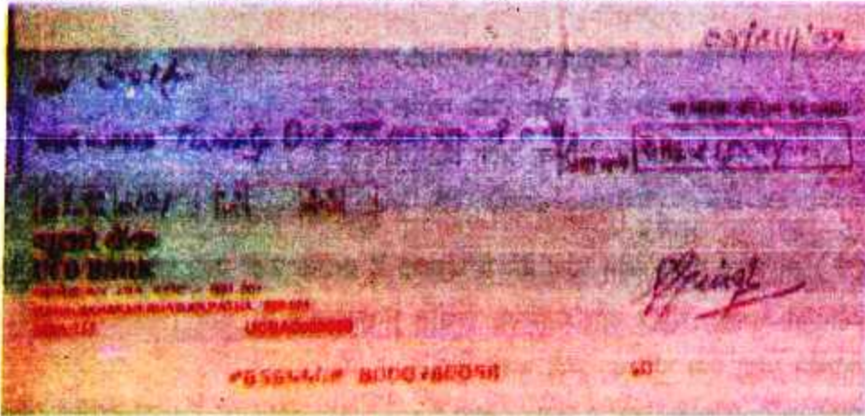
चित्र 3.7 : चेक

1. चेक (Cheque) — चेक सबसे अधिक प्रचलित साख पत्र है। चेक एक प्रकार का लिखित आदेश है जो बैंक में रुपया जमा करनेवाला अपने बैंक को देता है कि उसमें लिखित रकम उसमें लिखित व्यक्ति को दे दी जाए। चित्र 3.7 में चेक के नमूने को दिखाया गया है।