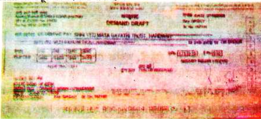
चित्र 3.8 : बैंक ड्राफ्ट

2. बैंक ड्राफ्ट (Bank Draft) — बैंक ड्राफ्ट वह पत्र है जो एक बैंक अपनी किसी शाखा या अन्य किसी बैंक को आदेश देता है कि उस पत्र में लिखी हुई रकम उसमें अंकित व्यक्ति को दे दी जाए। बैंक ड्राफ्ट के द्वारा आसानी से कम खर्च में ही रुपया एक स्थान से दूसरे स्थान भेजा जा सकता है। Bank Draft देशी तथा विदेशी दोनों ही प्रकार का होता है। चित्र 3.8 में Bank Draft के नमूने को दिखाया गया है -