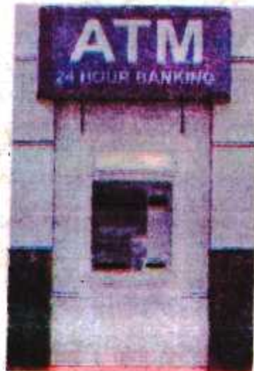
चित्र 3.5 : ATM मशीन

उपरोक्त चित्र 3.4 में ATM कार्ड को देखा। एटीएम कार्ड मिलने के बाद एक गुप्त पिन नं० होता है जिसकी सहायता से ATM कार्ड को एटीएम मशीन में डालने के बाद रुपया निकाला जा सकता है। एटीएम मशीन से रुपया कैसे निकाला जाता है? इसे निम्न चित्र 3.5 में दिखाया गया है-