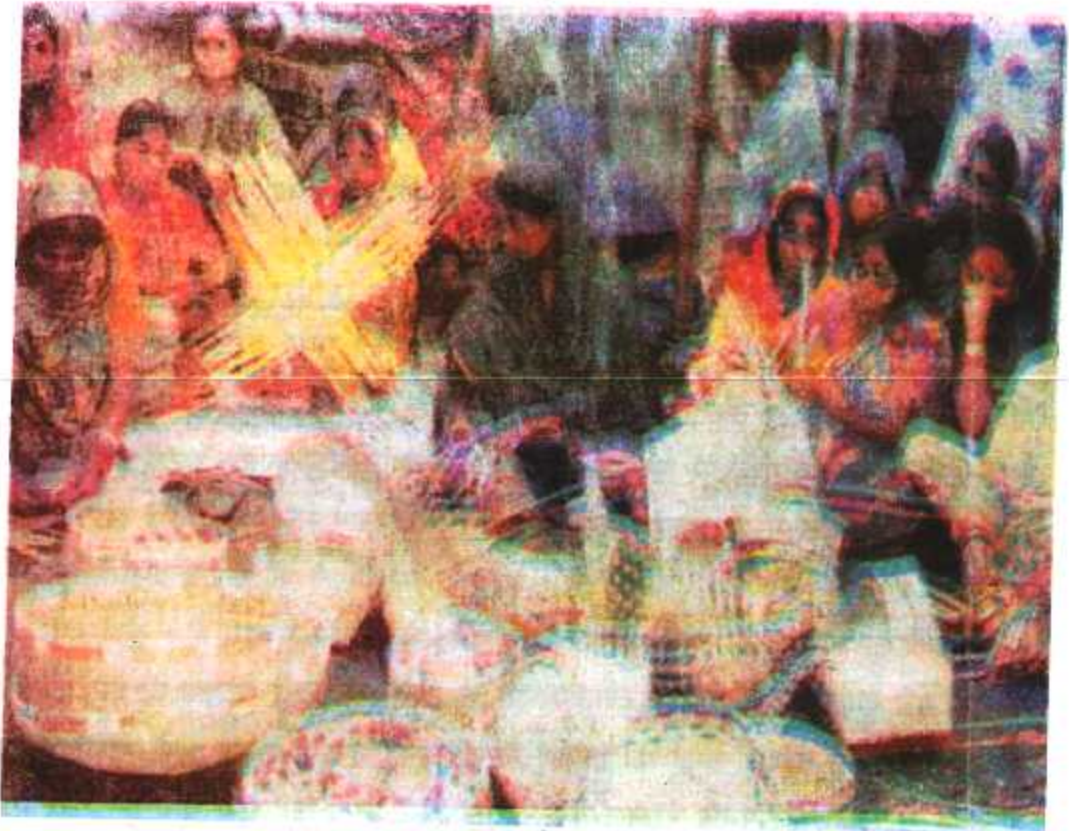
चित्र 4.2 : स्वयं सहायता समूह के द्वारा टोकरी निर्माण करती महिलाएँ

उपरोक्त चित्र संख्या 4.2 में स्वयं सहायता समूह के माध्यम से टोकरी बनाती हुई महिलाओं को दिखाया गया है।