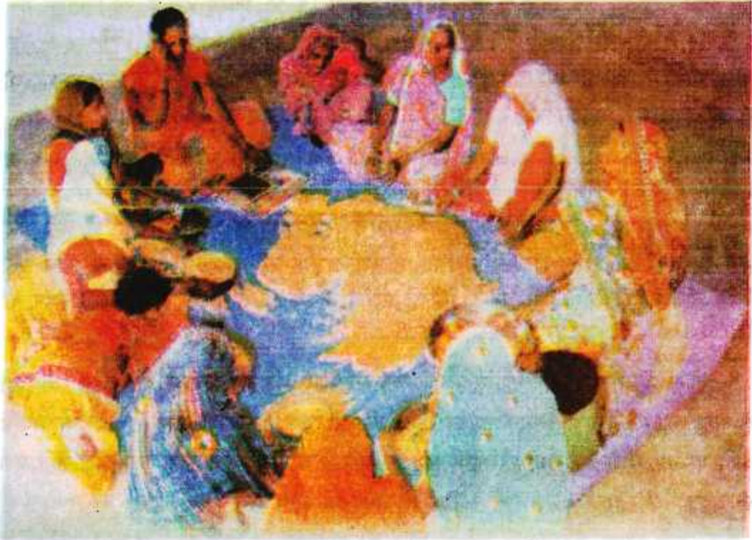
चित्र 4.1 : स्वयं सहायता समूह

इसे दिए गए चित्र संख्या 4.1 के माध्यम से आसानी पूर्वक समझा जा सकता है—