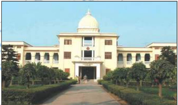
चित्र 4 – कलकत्ता विश्वविद्यालय

1854 की नीति का महत्त्व— इसी से भारत में आधुनिक शिक्षा के ढाँचे का निर्माण हुआ। प्राथमिक से लेकर उच्च शिक्षा तक के लिए एक नियम बनाया गया। शिक्षा संबंधी सभी मामलों पर सरकार का नियंत्रण हो गया। प्राथमिक शिक्षा की भाषा भारतीय रही जबकि उच्च शिक्षा का माध्यम अंग्रेजी को बनाया गया। उच्च शिक्षा को नियमित करने के लिए विश्वविद्यालयों को स्थापित किया गया। 1857 में तीन विश्व—