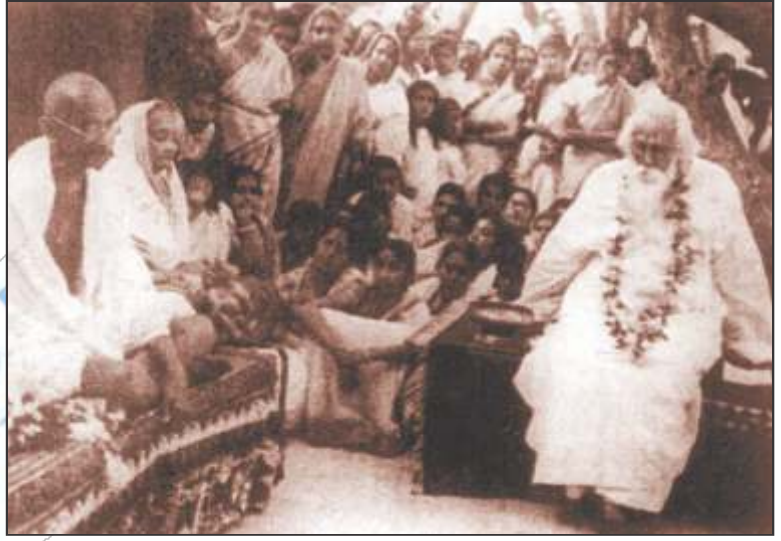
चित्र 6 – महात्मा गांधी और कस्तूबा गांधी शांति निकेतन में रवीन्द्रनाथ टैगोर और लड़कियों की एक टोली के साथ बैठे हैं, 1940

इस प्रकार बहुत सारे लोग इस बारे में सोचने लगे थे कि एक राष्ट्रीय शिक्षा प्रणाली की रूपरेखा क्या होनी चाहिए। कुछ लोग अंग्रेजों द्वारा स्थापित की गई व्यवस्था में परिवर्तन चाहते थे। उनका मानना था कि इस व्यवस्था को इस तरह फैलाया जाए कि उसमें ज्यादा से ज्यादा लोगों को पढ़ने के मौके मिले। इसके विपरीत बहुत सारे लोग ऐसे भी थे जो एक वैकल्पिक व्यवस्था चाहते थे ताकि लोगों को सच्चे अर्थों में राष्ट्रीय संस्कृति की शिक्षा दी जा सके। कौन तय करे कि सच्चे अर्थों में राष्ट्रीयता क्या होता है? इस "राष्ट्रीय शिक्षा" की बहस स्वतंत्रता के बाद भी जारी रही।