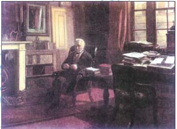
चित्र 3 – मैकॉले और उसका अध्ययन कक्ष

मैकॉले के मत को ही अंततः अंग्रेजी सरकार ने मान लिया। 1835 में इसी के आधार पर एक अधिनियम पारित किया गया। इसे ही आधुनिक शिक्षा अधिनियम के नाम से जाना गया। इस अधिनियम में यह व्यवस्था की गई कि अंग्रेजी उच्च शिक्षा का माध्यम होगा तथा भारतीय भाषाओं और उनमें दी जाने