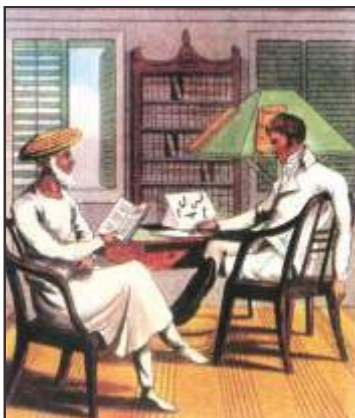
चित्र 1 - विलियम जोन्स फारसी भाषा सीख रहे हैं

इसके पीछे उनकी इस क्षेत्र में रूचि महत्वपूर्ण थी, ना कि शासन का उद्देश्य। इन लोगों में विलियम जोन्स प्रमुख थे। इस तरह के लोग जब से भारत आए थे तभी से यहाँ प्रचलित भाषाओं को सीख रहे थे जिनमें फारसी और संस्कृत प्रमुख भाषा थी। वे जानते थे कि इन्हीं दो भाषाओं में अधिकांश पुस्तकें लिखी गई हैं जिसमें भारत की संस्कृति सभ्यता और परम्परा की पूरी जानकारी है। फारसी और संस्कृत को सीख कर वे भारतीय पुस्तकों का अंग्रेजी में अनुवाद भी कर रहे थे। इसी क्रम में कालिदास रचित नाटक अभिज्ञान शाकुन्तलम्, हिन्दुओं के पवित्र ग्रन्थ 'गीता', मनुस्मृति, पंचतंत्र, हितोपदेश इत्यादि पुस्तकों का अंग्रेजी में अनुवाद किया गया। जोन्स साहब ने अपने इस काम को व्यवस्थित करने के लिए कलकत्ता में 1784 में एशियाटिक सोसाइटी ऑफ बंगाल नामक संस्था को भी स्थापित किया। इस संस्था से समय-समय पर एक पत्रिका भी निकाली जाती थी जिसमें प्राचीन भारतीय परम्पराओं और अच्छाइयों की चर्चा होती थी।