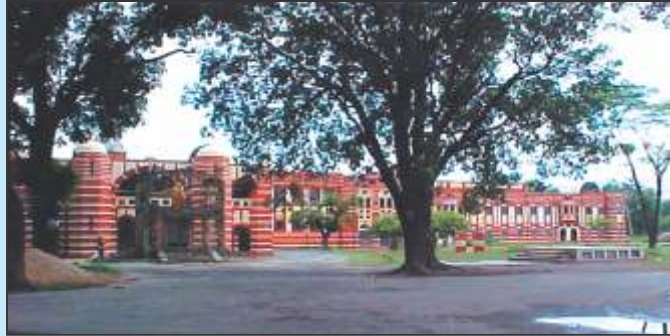
चित्र 7 – लंगट सिंह कॉलेज

लंगट सिंह कॉलेज – बिहार के पाँचवें एवं उत्तर बिहार के प्रथम कॉलेज के रूप में 1899 में स्थापित इस कॉलेज का बिहार में आधुनिक शिक्षा के प्रसार में काफी बड़ा