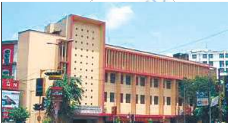
चित्र 2 - एशियाटिक सोसाइटी ऑफ बंगाल

विलियम जोन्स भारत के प्रति आदर और सम्मान का भाव अपने मन में रखते थे। वे मानते थे कि प्राचीन काल में भारत अपने वैभव के शिखर पर था। अगर भारत की श्रेष्ठता को