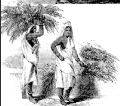
चित्र 11 - नील के पौधों को हौद तक औरतें ही ढोकर लाती थीं।

यहाँ आप उत्पादन की आखिरी अवस्था को देख सकते हैं। दबाकर साँचों में डाल दी गई नील की लुगदी को काटकर मजदूर उन पर मुहर लगा रहे हैं। पीछे वाले हिस्से में एक मजदूर इन टुकड़ों को सुखाने के लिए ले जा रहा है।