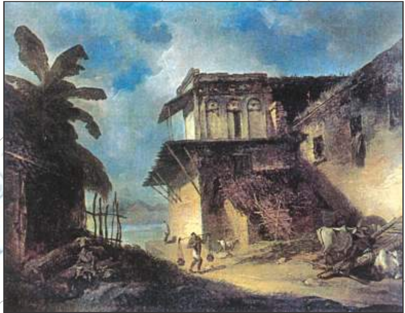
चित्र 1 – अंग्रेजों के समय का गाँव

करने की बोली लगाता उसे लगान वसूलने का अधिकार दे दिया जाता। इसे आप ठेकेदारी व्यवस्था कह सकते हैं। परंतु यह व्यवस्था ज्यादा दिनों तक नहीं चल पायी। इस व्यवस्था में ठेकेदारों को फायदा हो रहा था। वे तय राशि से जितना ज्यादा वसूल करते वह उनका ही हो जाता था।