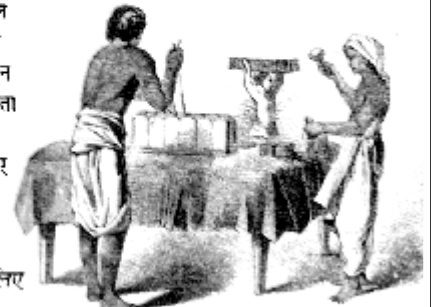
चित्र 13 - बिक्री के लिए नील तैयार है।

जाता था और नीचे जमी नील की गाद - नील की लुगदी - को दूसरे कुंड (निथारन कुंड) में डाल दिया जाता था। इसके बाद उसे निचोड़कर बिक्री के लिए सुखा दिया जाता था।